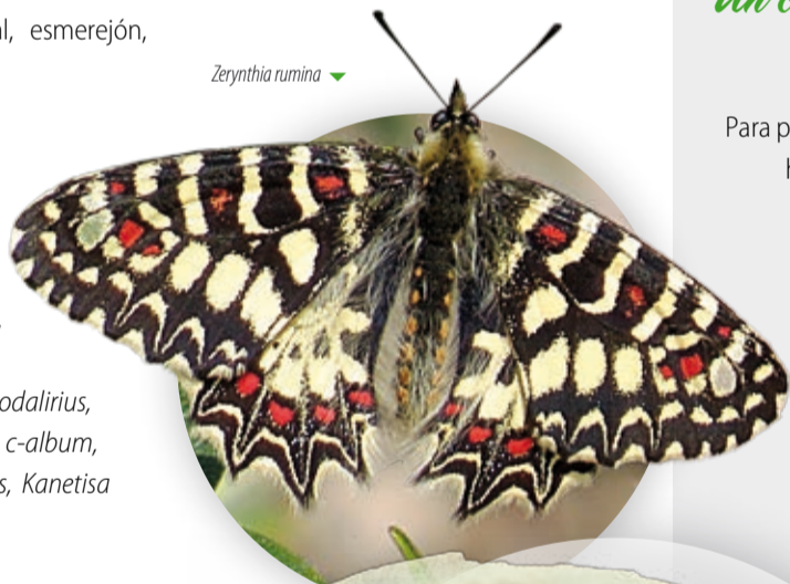
Zerynthia rumina ▼