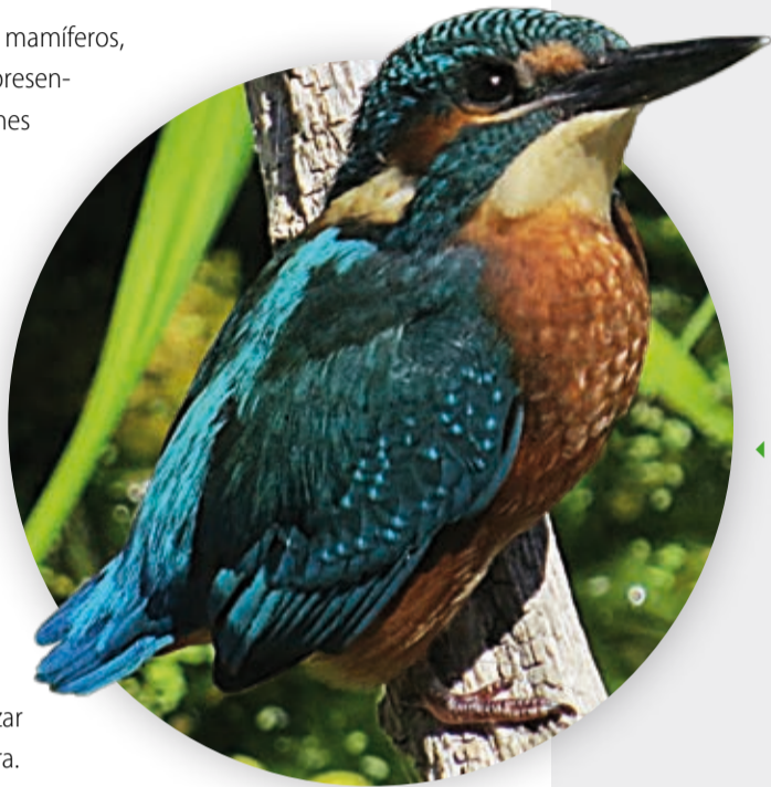
◀ Martín pescador ( Alcedo atthis )